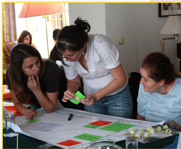
Дел од учесниците на една од практичните вежби на обуката

Како дел од курсот за застапување и лобирање учесниците поминаа низ идентификацијата на прашањето или проблемот за кое ќе се застапува или лобира, низ целите, партнерствата и сојузите што ќе се направат, низ справувањето со моќ, понатаму разговараше за вклучувањето во креирањето политики, самото креирање политики и на крајот самите анализираа подготвени policy paper.