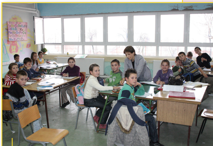
Со новите прозорци во ОУ „Гоце Делчев“ во Конче, нема провев и децата поретко се разболуваат