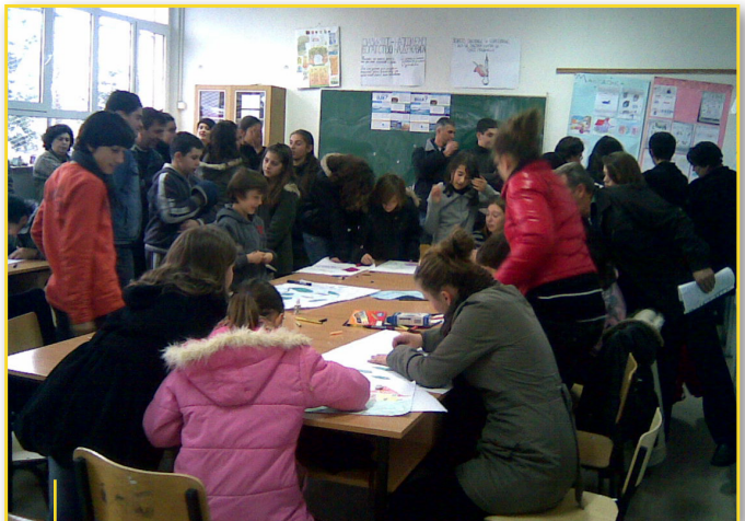
Едукативните часови беа масовно посетени и прифатени со голем ентузијазам

На крајот на настанот на сите деца им беа доделени подароци.