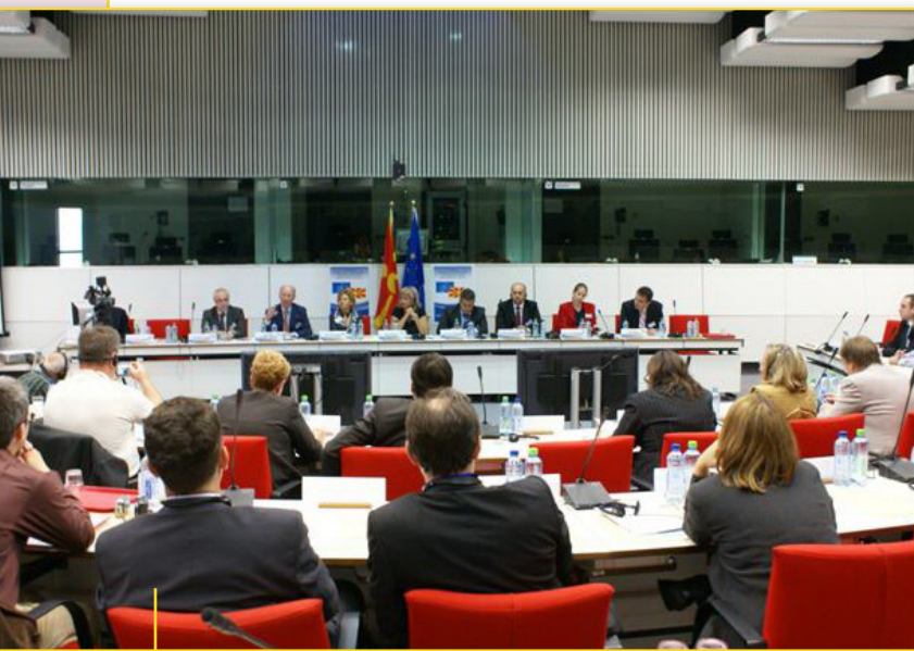
Од инаугуративниот состанок на ЗКК во Брисел

На 25 септември 2009 година, Европскиот економски и социјален комитет (ЕЕСК) беше домаќин на првиот Заеднички консултативен комитет (ЗКК) на граѓанското општество на ЕУ и Република Македонија. ЗКК е заедничко консултативно тело кое има за цел да ги набљудува односите помеѓу ЕУ и Република Македонија од гледна точка на граѓанското општество. ЗКК ќе ги промовира контактите и дискусијата помеѓу претставниците на граѓанското општество на двете страни по прашања од заеднички интерес.