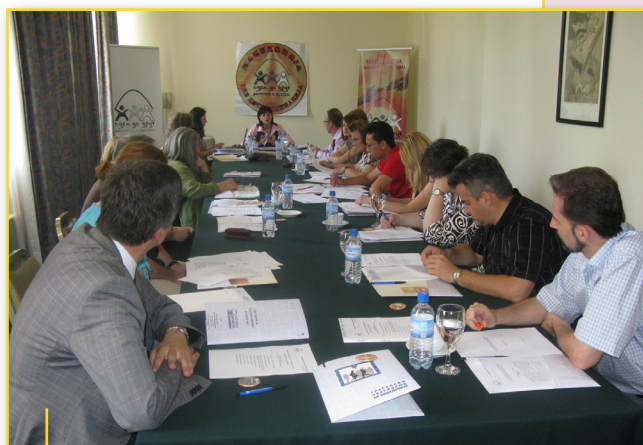
Од основачкото Собрание на Сојузот МБД

Основачи на Сојузот се: Асоцијацијата за демократски иницијативи од Гостивар, Ел хилал, од Скопје, Македонскиот центар за женски права - Шелтер центар од Скопје, Македонскиот центар за меѓународна соработка од Скопје, Националниот совет на жените на Македонија - СОЖМ од Скопје, Полио плус-движење против хендикеп од Скопје, Првата детска амбасадана светот Меѓаши од Скопје, Хуманитарното и добротворно здружение на Ромите „Месечина“ од Гостивар, ХОПС – опции за здрав живот од Скопје, Центарот за човекови права и разрешување конфликти од Скопје и „Универзитет“ Трето доба од Скопје.