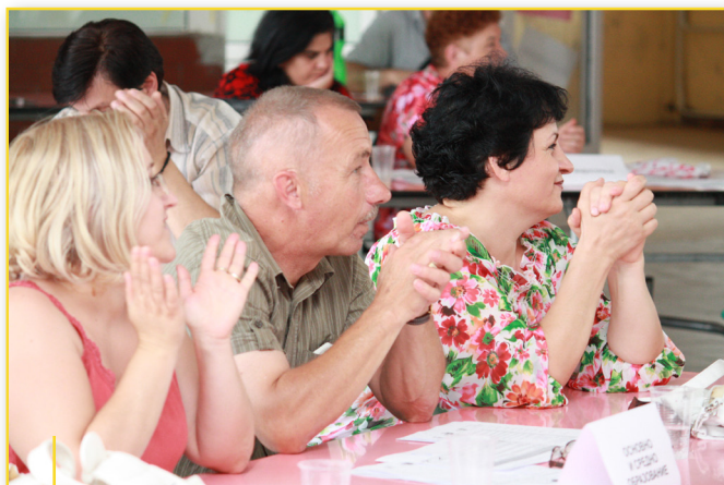
Граѓаните на Битола го поздравуваат изборот на приоритетните проекти што ќе се финансираат со средства од програмата

Во 2009 година, беа одржани 5 форумски сесии во Ресен и 5 во Битола. Жителите