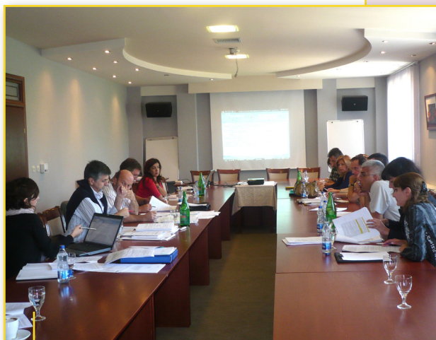
Од еден од состаноците на работната група што работеше на текстот на предлог - Законот

Покрај исполнувањето на меѓународните регулативи и практики новиот закон ќе биде насочен и кон решавање на секојдневните пречки и проблеми во развојот на граѓанското општество.