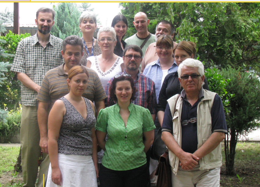
Учесниците на Основачкото собрание на Балканската мрежа за развој на граѓанското општество

Балканската мрежа за развој на граѓанското општество (БЦСДН) по осум години, кога започна како пилот-проект и пет години функционирање како мрежа, на 1 октомври 2009 година е регистрирана како правен субјект. На 6 јули се одржа основачкото собрание каде беа усвоени Статутот и Стратегиската ориентација 2009-2011 и беше избран Советот, Одборот и Извршниот директор.